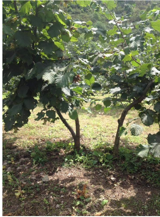
Çit dikim sisteminde şekil budaması yapılmış fındık fidanları

3-Verim (Ürün) Budaması: Fındıkta tam verim çağı çeşide, bakım şartlarına ve ekolojiye göre değişmekle birlikte 20-25 yaşlarına kadar devam etmektedir. Bundan sonra ana dallar üzerindeki yan dallarda sıklaşma, sürgün faaliyetlerinde ve buna bağlı olarak da verimde azalmalar gözükür.