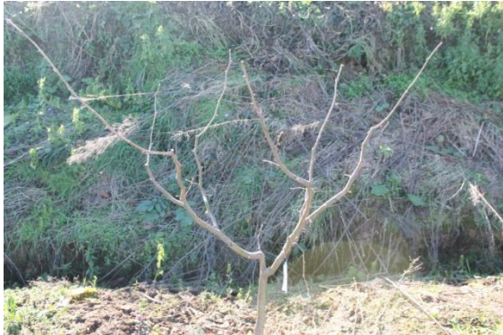
Tek gövde dikim sisteminde şekil budaması yapılmış bir fındık fidanı