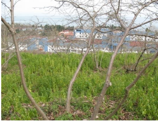
Ocak dikim sisteminde şekil budaması yapılmış bir fındık ocağı

2-Şekil Budaması: Fındık yetiştiriciliğinde ocak dikim sistemi üreticiler tarafından kullanılmakla birlikte tek gövde, çit dikim sistemleri de yaygınlaşmaktadır. Şekil budaması dikim sistemine bağlı kalarak her yıl dal üzerinde yapılan budamaları kapsamaktadır.