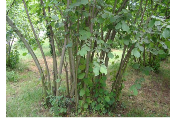
Dip temizliği yapılmamış bir fındık ocağı

Fındık ocaklarında her yıl bol miktarda gelişen kök sürgünleri, daha sonra dalların gençleştirilmesi amacıyla kullanılabileceği yönüyle yararlı gibi gözükürken, ihtiyaçtan fazlası ocakların yeterince güneşlenememesine, havalanmanın ve tozlanmanın yetersiz olmasına, dalların sıklaşmasına, gereksiz su ve besin elementi sarfiyatına neden olmaktadır.